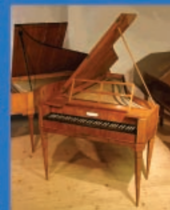
Mozartfögel im "Clavierland"

Das "Clavierland" im Schloss Kremsegg bietet den Referenten einen idealen Rahmen um formulierte Inhalte auch akustisch zu demonstrieren.